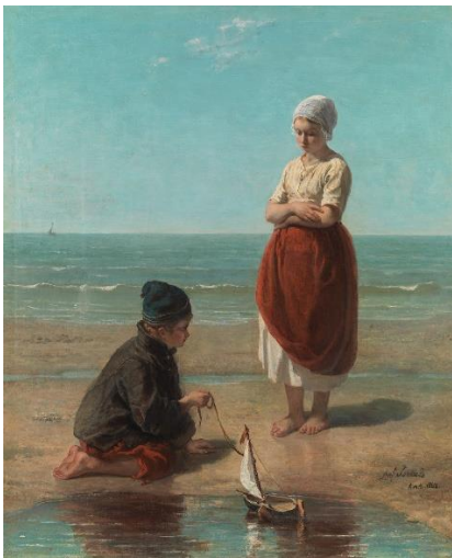
Kinderen der zee, Jozef Israëls, 1863. Collectie Amsterdam Museum, collectie Van Eeghen https://we.tl/t-ON1RSzyVol