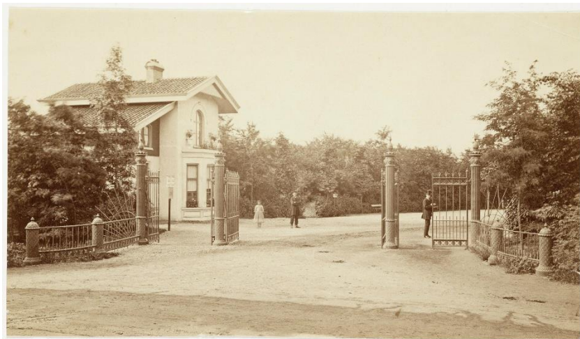
Vondelpark.