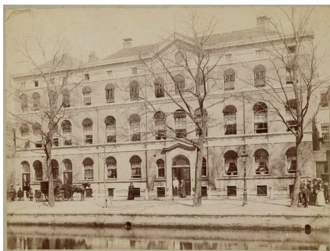
Prinsengrachtziekenhuis ca. 1880. Vervaardiger onbekend. - Collectie Stadsarchief Amsterdam, collectie Frits Knuf https://archieff.amsterdam/beeldbank/detail/7ab08ea4-eb82-c35d-546d-5fdfcbc433ed