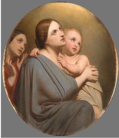
Zalig zijn de reinen van geest (1849), Ary Scheffer (1795-1858) - https://we.tl/t-LWtNNNSA85