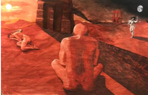
The Place Where the Hickories Will Grow (2022), Myles Jackson Lynch

ooit weer terugkeren in het gebied. De okkernotenboom is een belangrijke boomsoort voor de Lenape en hoort volgens Lenape weelderig te groeien in het gebied, een groot contrast met bebouwing en asfaltwegen. Tenslotte wordt in deze ruimte stilgestaan bij de opkomst van de lucratieve handel in beverhuiden. Deze handel kan worden zien als de aanleiding voor de Nederlandse invasie en kolonisatie van het gebied.