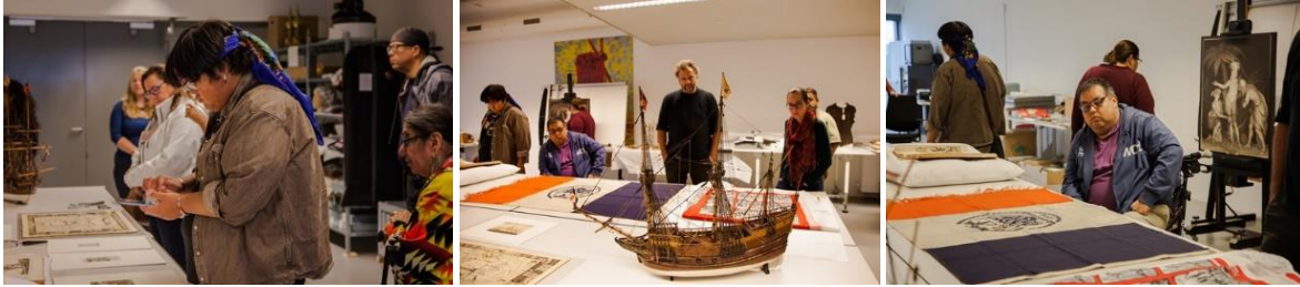
In voorbereiding op de tentoonstelling bezochten vertegenwoordigers van de Lenape en het Museum of the City of New York op 30 oktober 2023 het Collectiecentrum van Amsterdam Museum.

“Samenwerking tussen de partijen is echt aftasten. Met zo'n beladen geschiedenis vol geweld en met doorlopende consequenties voor de Lenape is het niet verrassend dat institutionele partners het vertrouwen langzaam moeten winnen. Ik heb respect voor de Lenape die bereid zijn om hun kennis en ervaringen te delen met ons. Het uitgebreide besluitvormingsproces is wennen. Zo zullen we voor het eerst de tentoonstellingszalen in het Amsterdam Museum spiritueel reinigen en inwijden.”