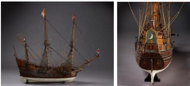
Model van het schip De Halve Maan (19e eeuw), vervaardiger onbekend. Collectie Amsterdam Museum

In de volgende zaal zijn objecten uit Nederlandse museale collecties te zien. Uit de presentatie van deze prenten, documenten en een scheepsmodel blijkt hoe het in Nederland bewaarde erfgoed steeds één, Europees, perspectief op de komst van Nederlanders in Manhattan laat zien. De koloniale zeevaart wordt gesymboliseerd door het scheepsmodel van De Halve Maan, het schip waarmee Henry Hudson de baai voor New York binnenzeilde. De Europese blik op een vreemdeling is te zien in de vorm van een 17 e -eeuwse prent, getiteld Portret van een man uit Tsenacommacah (Virginia) op 23-jarige leeftijd (1645) door Wenseclaus Hollar. Het is een prent van een Inheems persoon in Nederland (waarschijnlijk Lenape) waaruit verwondering blijkt. Geweld, zoals de moord op vele Inheemse personen, de roof van grondstoffen en verdrijving van Lenape uit hun land, is in het erfgoed niet zichtbaar. Een onderbelicht deel van de Nederlandse geschiedenis. In audio- en videofragmenten reflecteren Lenape op dit Nederlandse erfgoed en voegen zij perspectieven toe aan het dominante verhaal. In de fragmenten worden vragen gesteld door Lenape voor verder onderzoek in aanloop naar de tentoonstelling in New York in 2025. Bijvoorbeeld naar aanleiding van de genoemde prent. Is er informatie te vinden over Lenape die eeuwen terug in Amsterdam waren? Hoe kwamen zij hier terecht?