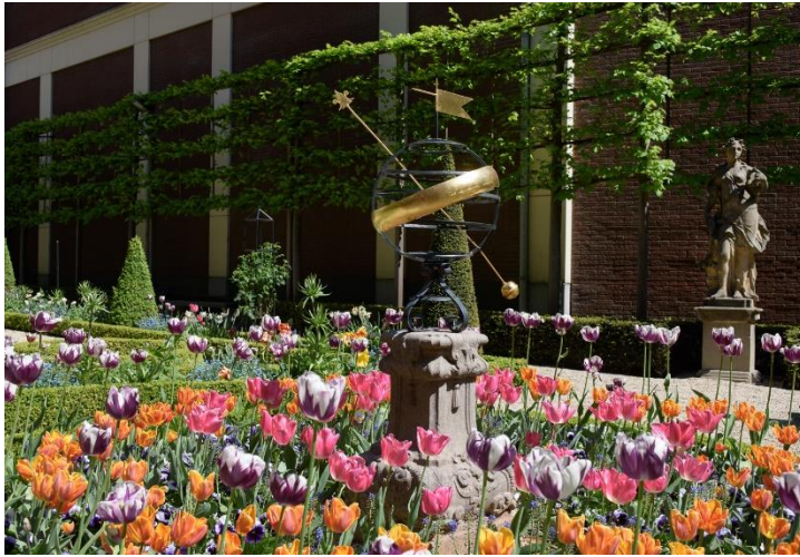
Tulpentuin in Huis Willet-Holthuysen, 2023, Amsterdam Museum

Info: www.amsterdammuseum.nl/publieksprogramma/tulp-festival-2024