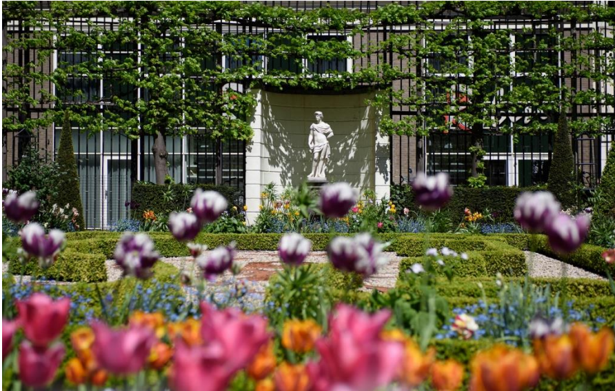
Tulpentuin in Huis Willet-Holthuysen, 2023, Amsterdam Museum