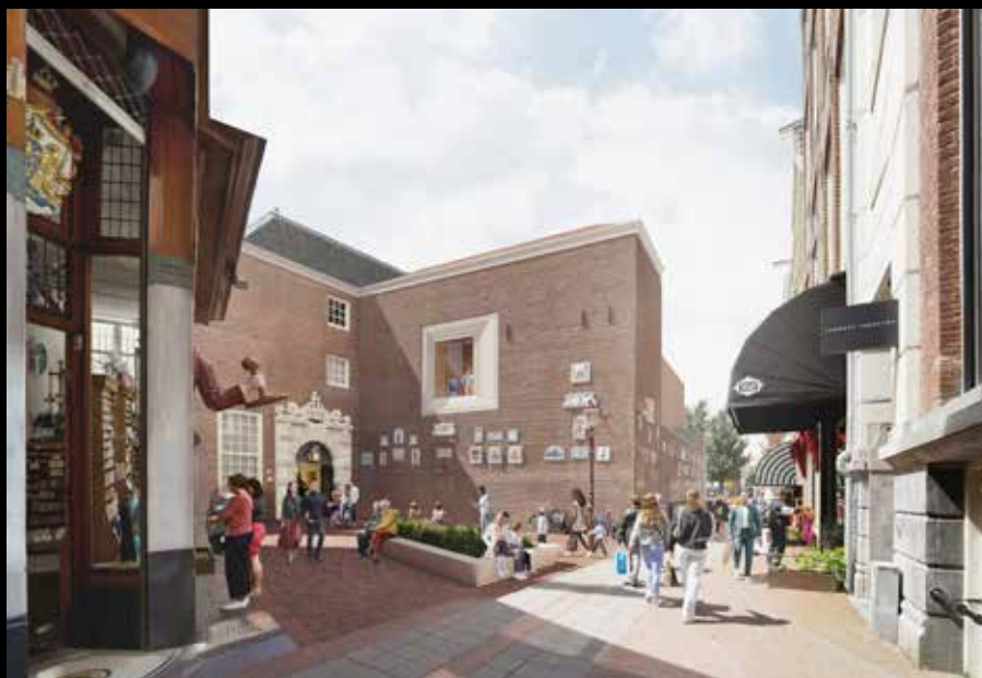
Rechts: Visualisatie van de ingang St. Luciënsteeg. Onder: Visualisatie van de Nieuwezijds Voorburgwal met restaurant.

Het nieuwe Amsterdam Museum opent naar de stad. Voorheen gesloten ramen en deuren gaan open. De galerijen rond de Stadshal en alle binnenpleinen zijn gratis toegankelijk voor iedereen. Bovendien is het museum ook toegankelijk voor mensen die minder goed ter been zijn. Iedereen weet straks gemakkelijk de weg te vinden naar en in het nieuwe Amsterdam Museum.