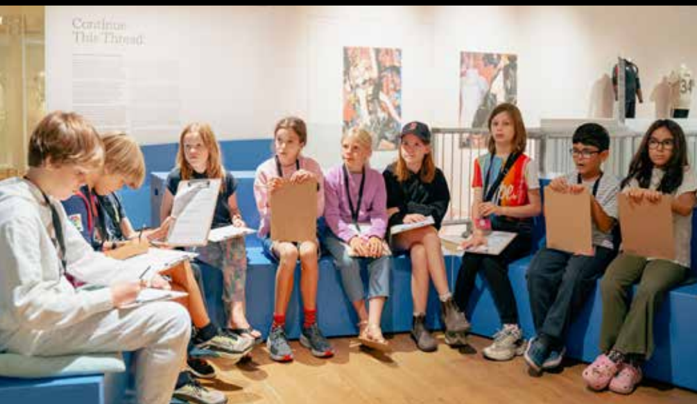
Educatieprogramma ELJA Kindermuseumlab.