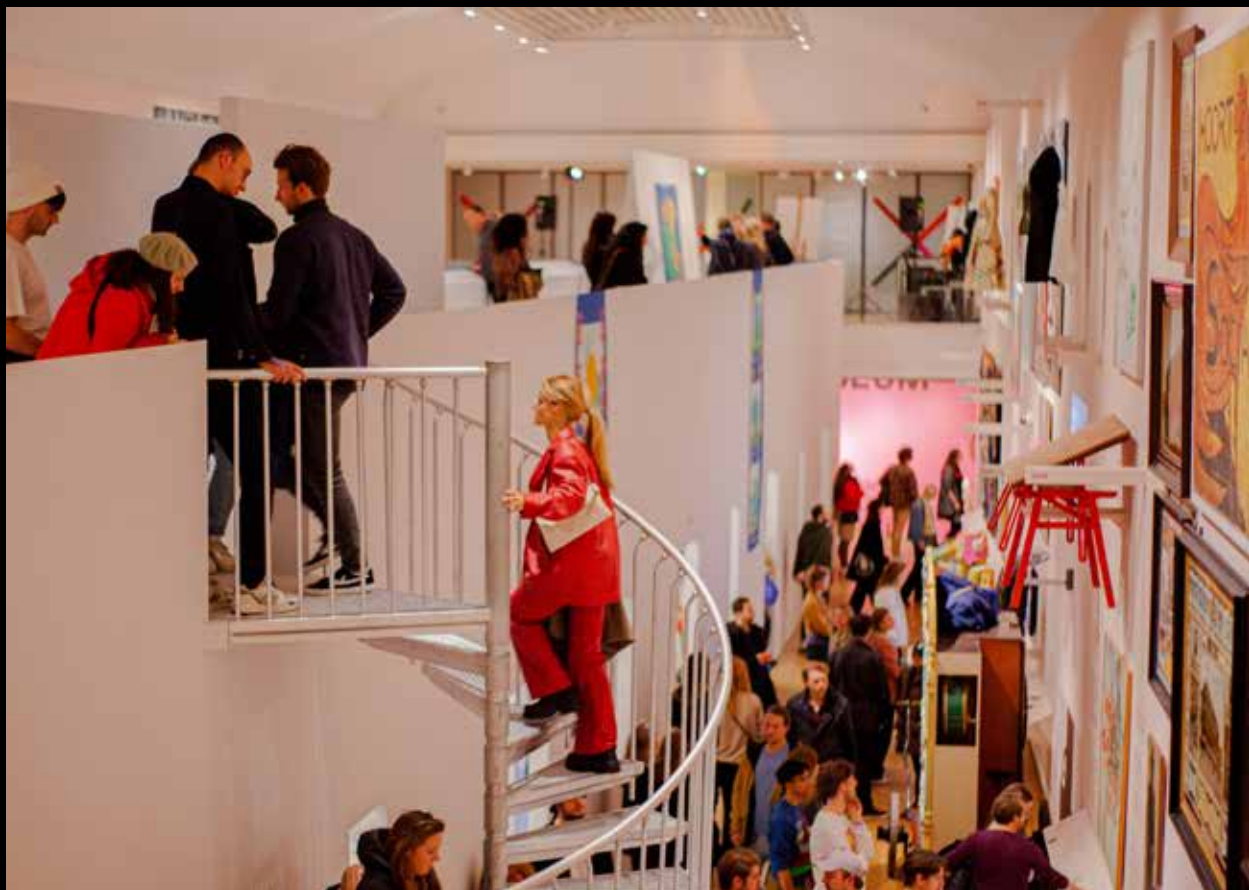
Vaste tentoonstelling Panorama Amsterdam.