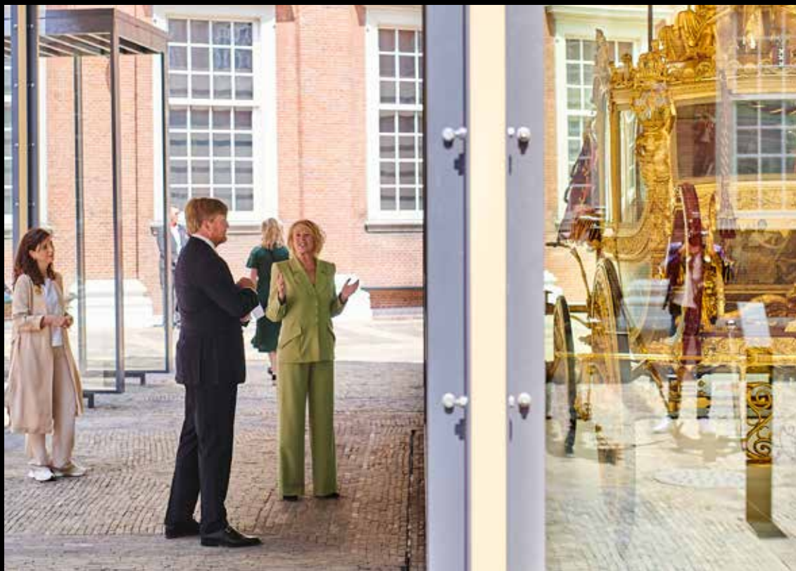
Opening tentoonstelling De Gouden Koets door ZKH koning Willem-Alexander.