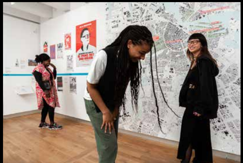
Bezoekers aan de tentoon- stelling Collecting the City, Operatie Wonen.